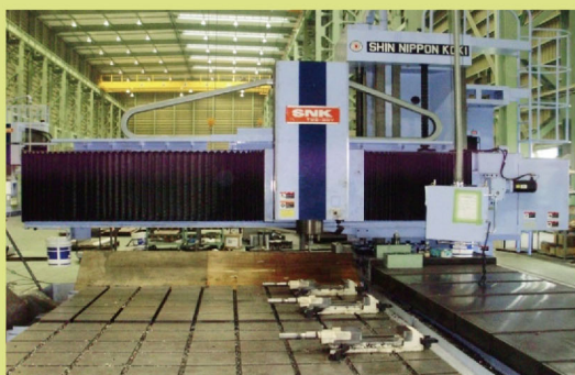
新日本工機 トラバースタイプ TMS-30 1台 ストローク X6000 Y3000 Z1900