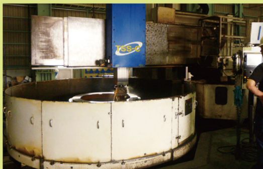
東芝機械マシナリー TSS-30/55C-S シングルコラム形ターニング 最大振り \phi 5500 テーブル \phi 3000 ミーリング 12本