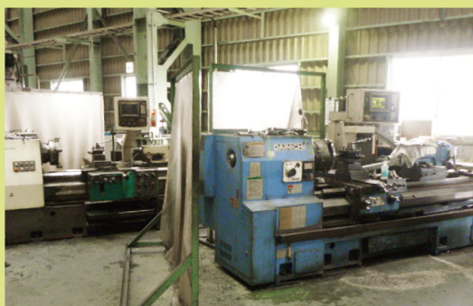
NC旋盤 DAINITI DL65 芯間 L1500