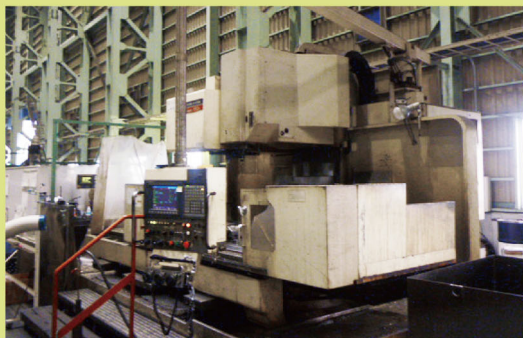
オークマ豊和マシニングセンタ MILLAC 1052V X2050 Y1060 Z800