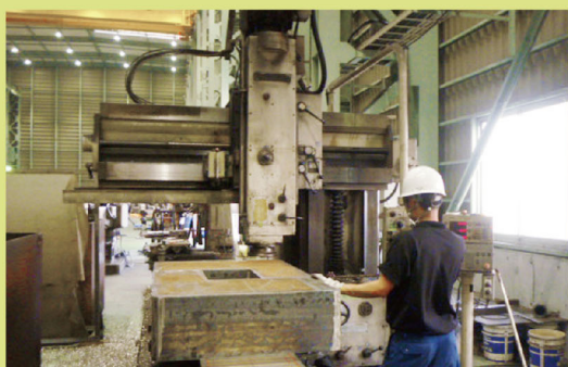
KOTOBUKI プラノミラー ストローク X3300 Y1100