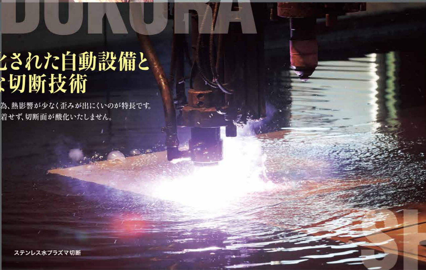
ステンレス水プラズマ切断

水中での切断の為、熱影響が少なく歪みが出にくいのが特長です。 またヒュームが付着せず、切断面が酸化いたしません。